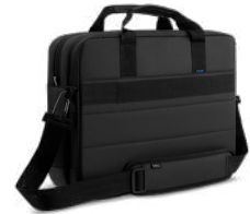
Dell EcoLoop Pro 單肩提包 - CC5623

採用全球最佳影像品質的 4K 網路攝影機，透過大型 4K Sony STARVIS™ CMOS 感測器和人工智慧自動構圖功能，將您的視覺效果最佳化，提升您的視訊會議體驗。