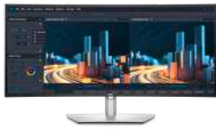
Dell UltraSharp 34 USB-C 集線器曲面顯示器 - U3421WE

34 吋 WQHD 曲面顯示器具備廣泛的色彩涵蓋範圍和多種連線能力，包括 RJ45、USB-C 和快速存取正面連接埠，讓您全心投入工作，維持高生產力。